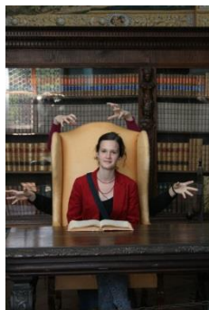
Zabavno čitanje u Trakošćanu

Ako vam se svidio ovaj projekt, vi najbolje znate zašto. Ne ustručavajte se, nego mi se javite kako bismo zajedno ostvarili projekt u kojem će se naši učenici – korisnici osjećati kao da doista netko brine i o njihovim potrebama ne samo školskim obavezama. A taj netko će, ni manje ni više, biti školski knjižničar. ☺