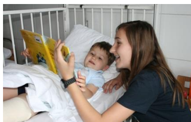
Čitamo djeci u bolnicama

Grupa s noćnog čitateljskog susreta unutar godine čita iz užitka ljudima u lokalnoj zajednici najmanje tri puta na postojećim ili na vlastito osmišljenim događanjima da bi se projekt smatrao napravljenim, a ostala čitanja su po vašem izboru i ulaze u konkurenciju za najbolju knjižnicu projekta. Uz već spomenutu, za provođenje projekta bit će vam poslana i sva potrebna preostala dokumentacija poput roditeljskih suglasnosti, evaluacijskih listića, izvješća i sl.