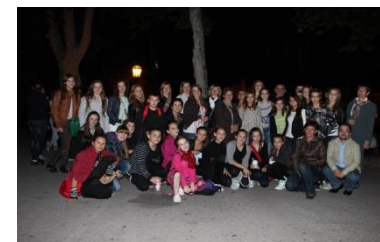
1. Završna svečanost na Zrinjevcu 2012. s Perom iz Opće opasnosti

Snimljene materijale i objave u medijima stavljamo na web 2.0 profile. Povjerenstvo (član HMŠK, član HUŠK, poznati kulturni i javni djelatnik) posljednjih mjesec dana proglašava najuspješniju knjižnicu na temelju Pravilnika koji će vam isto stići s ostalim dokumentima.