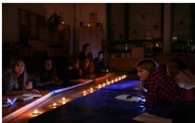
Naše prvo noćenje u knjižnici 2009.