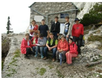
Čitamo u planinama

Ako vam se svidio ovaj projekt, vi najbolje znate zašto. Ne ustručavajte se, nego mi se javite kako bismo zajedno ostvarili projekt u kojem će se naši učenici – korisnici osjećati kao da doista netko brine i o njihovim potrebama ne samo školskim obavezama. A taj netko će, ni manje ni više, biti školski knjižničar. ☺